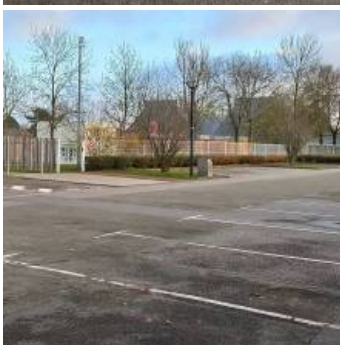
Salle de festivit  au Trait d'union 22, Rue des Ecoles Jean Baudin 78114 Magny-les-Hameaux